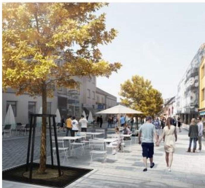
Vizualizace rekonstrukce ulice Nádražní