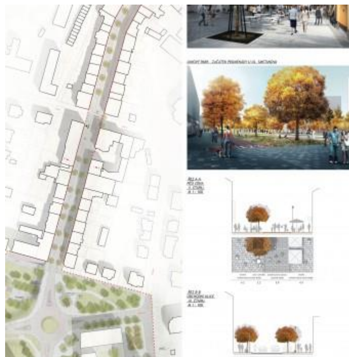
Vizualizace rekonstrukce ulice Nádražní