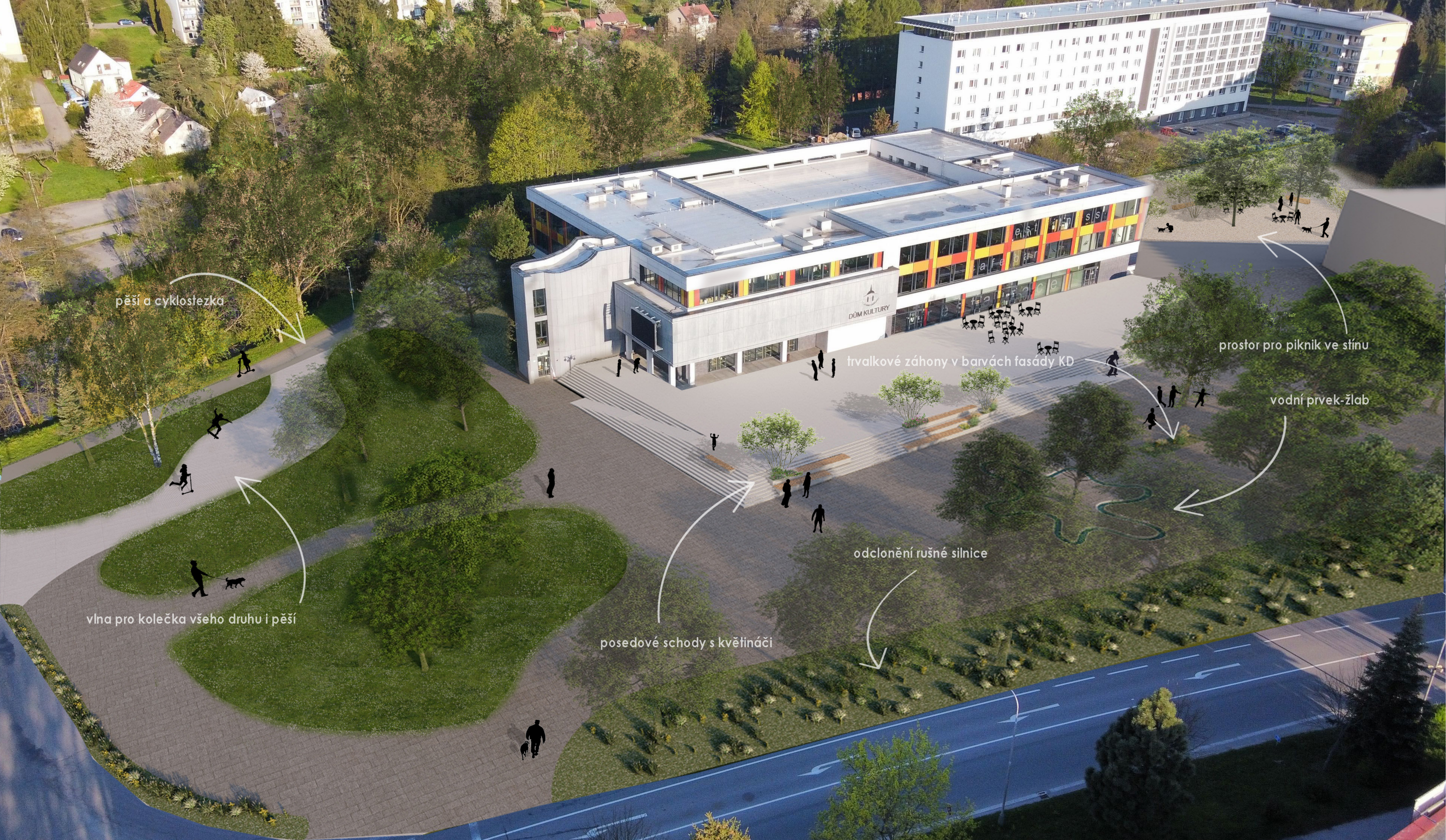
ZÁKRES NÁVRHU DO NADHLEDOVÉ FOTOGRAFIE